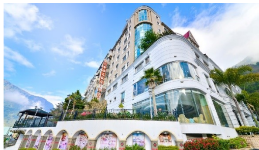
東埔溫泉 帝綸大飯店