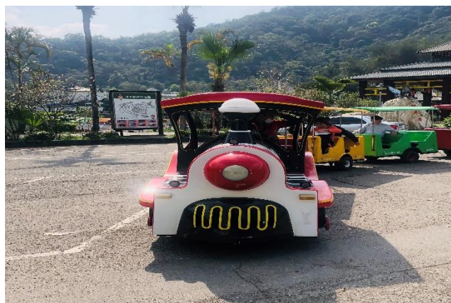
鯉魚潭彩色小火車